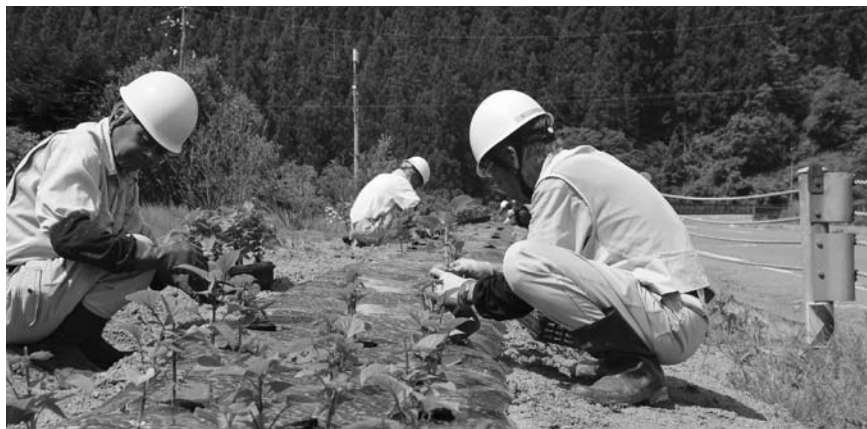
美しい村推進事業