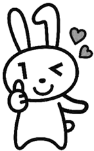
マイナンバーカード PRキャラクター 「マイナちゃん」