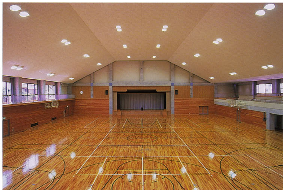
▲多目的に使える体育館