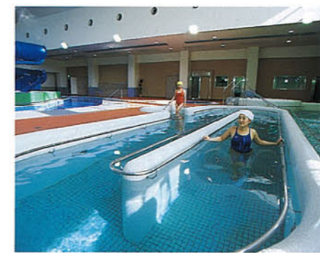
▲歩行浴 全身お湯につかり、歩くことによって体力の維持増進に役立ちます。