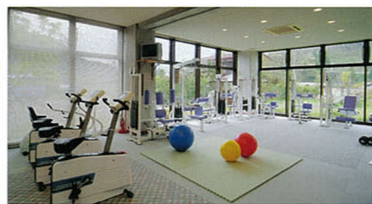
▲トレーニングルーム