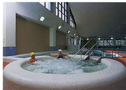
▶ジャグジー 競泳用プールなどで冷えた体をあたためます。