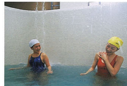
▲うたせ湯 高圧水流を落下させるマッサージ浴槽です。

泳いで遊んで、バラエティいっぱい入浴施設でリラックス。赤ちゃんからお年寄りまで、マイペースで楽しめる充実の温水プールで、心と体の健康づくりをしませんか。