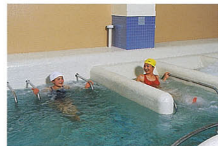
▲ジェットバス 背・腰へ強いジェット流をあて、疲労を取り去ります。