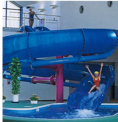
▲ウォータースライダー