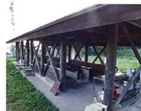
バーベキューエリア