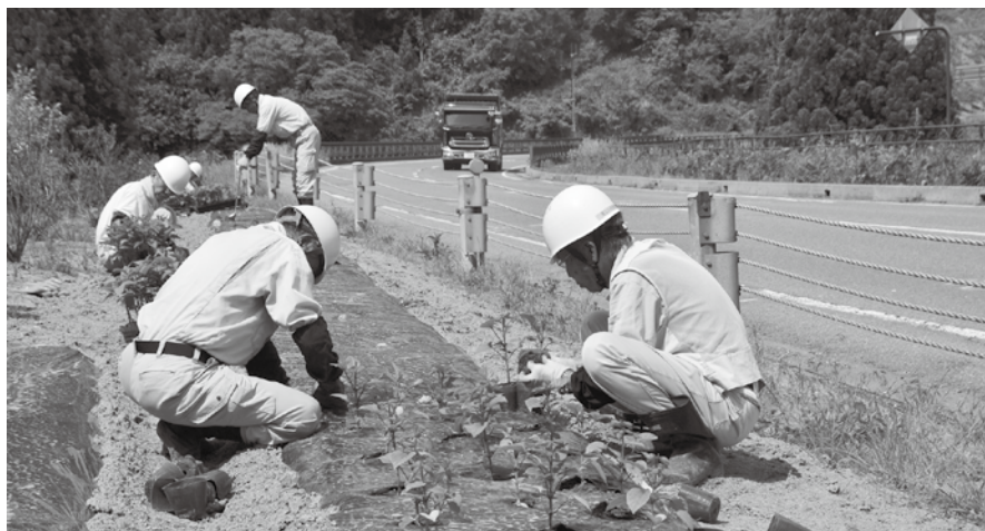
美しい村推進事業