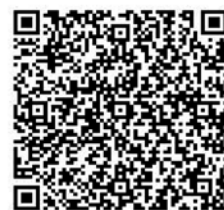
協賛店舗登録用ページ （ながの電子申請サービス）