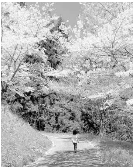
最優秀賞 長野市 山口様