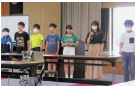
塾生による抱負の発表

令和5年度「土曜おがわ未来塾」が開講しました。この公設学習塾は、小学4年生から中学3年生までを対象に昨年度より実施しています。主に自主学習や個別指導による学習を行う