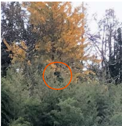
民家から50m程先のイチョウヘ登るツキノワグマ(11月 塩沢)

年末年始で家族が集まるこの機会に、ご自宅近くの柿の木などの伐採についてご検討ください。