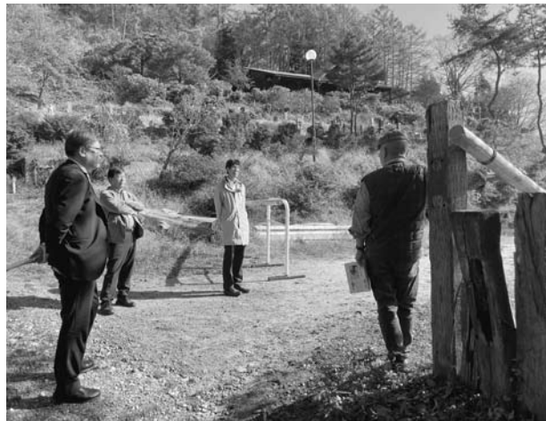
審査風景（明松寺馬事公苑）

「日本で最も美しい村」連合資格審査員の2名が訪れ、1日目は、景観整備した箇所や薬師沢石張水路工、小川神社（御柱祭）、立屋の桜の地域住民の取り組みについて現地視察を行いました。