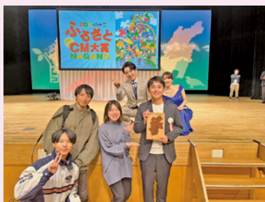
昨年度の応募作品は感動賞を受賞しました！